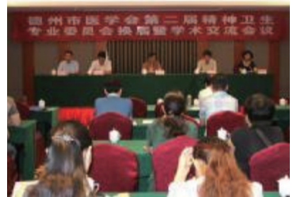
抑郁症防治指南解读》《双相障碍治疗新进展》进行了精彩的学术讲座。

示,我院作为全市唯一一家专业治疗精神疾病的市级专科医院,承担着全市精神卫生工作的重任,医院将进一步加强业内沟通交流,增加相关诊疗区域的联动与合作,规范精神卫生专业的诊疗过程,实现临床各亚专业规范化、科学化发展。发挥好学科引领作用,推动全市精神卫生工作再上新台阶。会后,山东大学博士生导师刘金同、上海交通大学硕士生导师蔡军、我院精神卫生中心主任医师于建新分别就《精神分裂症的全病程治疗》《中国