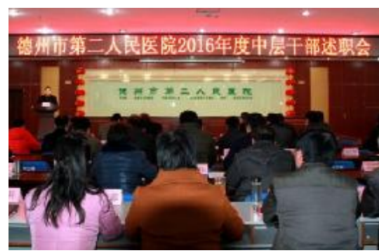
德州市第二人民医院2016年度中层干部述职会

与推广,提出了加强京津冀冀名院名医的合作交流,打造全市及周边地区胸外科专业领域技术高地的目标。随后,60余位中层干部讲述了个人经验和体会,用实绩说话,用真情交流体会,用责任诠释工作,对工作中存在的问题进行了反思,并对下一步工作提出规划设想。最后,高院长对我院2016年各项工作给予高度评价,并就17年工作进行了战略部署,